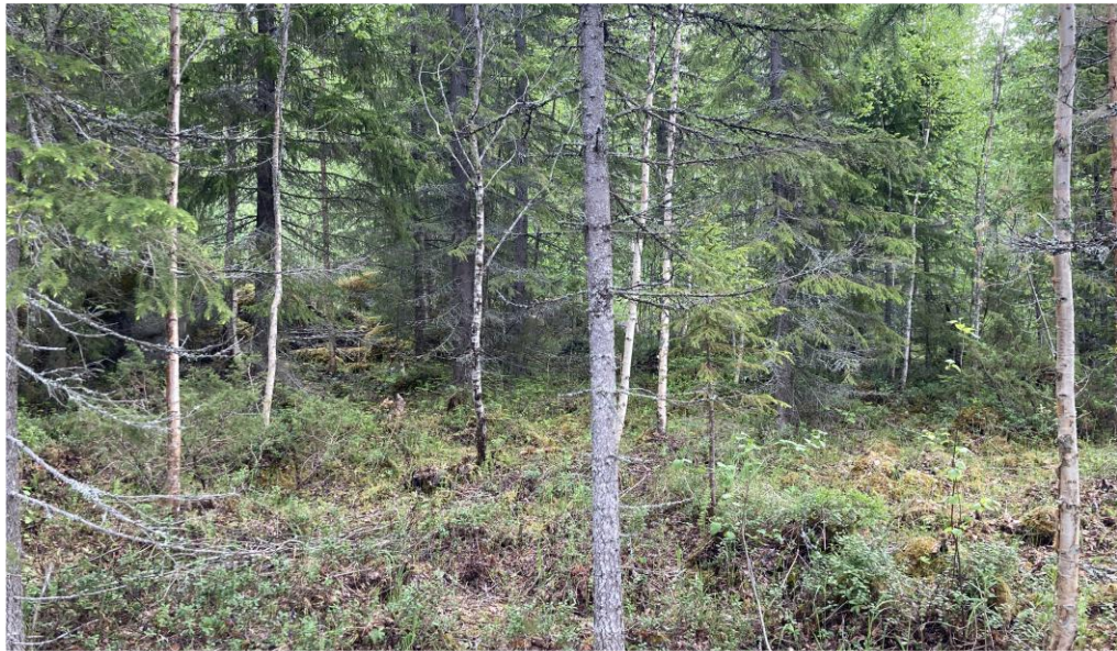
Figur 3, Vy från vattnet sett över tänkt placering av fritidshus.