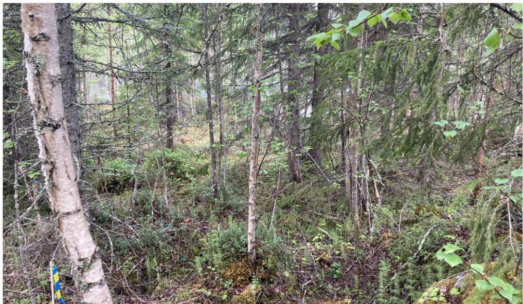
Figur 2, Vy över tänkt placering av fritidsbus, käpp nere i vänster hörn är sydöstra hörnet på byggnaden.